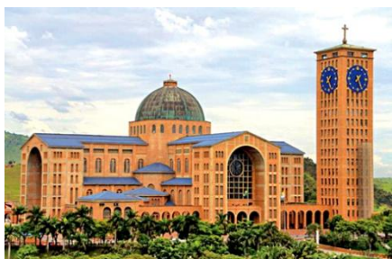
SANTUÁRIO NACIONAL DE APARECIDA

1- LIGUE OS LUGARES DE PEREGRINAÇÃO AS SUAS RELIGIÕES.