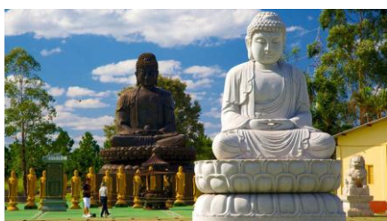
TEMPLO BUDISTA EM FÓZ DO IGUAÇU